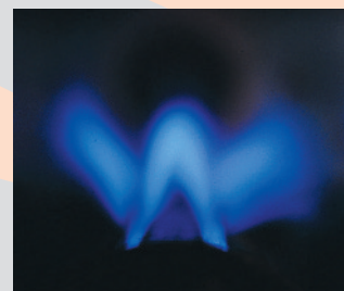
Der COMBIGAS-REDOX, ein Blick auf die Brennerlanze mit Schmetterlingsflamme